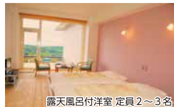
露天風呂付洋室 定員2~3名

「自ら美しくなる・健康になる・心と体が癒される」ことに特化したご宿泊は、癒しとリフレッシュ効果を最大限に感じることが出来る贅沢なひとときです。高付加価値&リーズナブル価格でのご宿泊をぜひご体験ください。