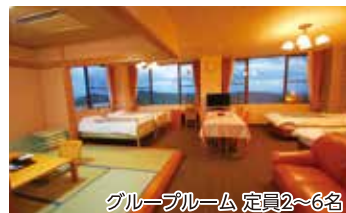
グループルーム 定員2~6名