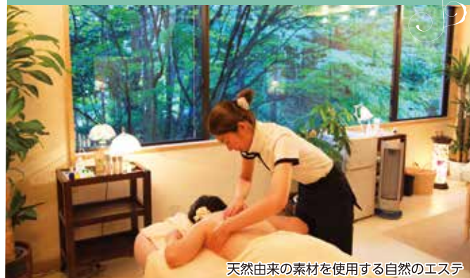
天然由来の素材を使用する自然のエステ